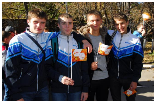
Учащиеся лицея №2 перед эстафетой огня